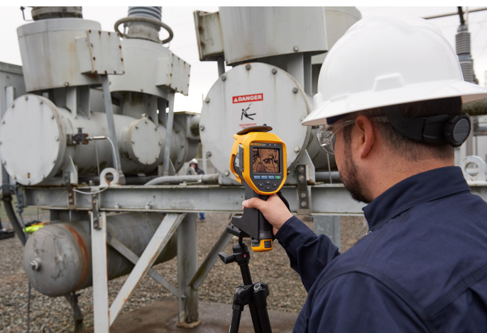
Рисунок 1. Специалист по осмотру использует газовый детектор Fluke Ti450 SF6 для осмотра болтовых соединений.

Оборудование подстанций, включая выключатели и трансформаторы, осуществляют коммутацию и трансформацию высоких напряжений и токов. При коммутации высокого напряжения возникает риск возникновения вспышки дуги, которая представляет угрозу безопасности и стабильности производственных процессов. Для изоляции в таком оборудовании используется газ SF 6 . Этот парниковый газ является более эффективной альтернативой таким изоляторам, как воздух и масло, благодаря своим ионизационным свойствам при использовании в качестве гасящего газа. Тем не менее, поскольку этот газ обладает сильными парниковыми свойствами, важно обеспечить своевременное обнаружение его утечки и принятие соответствующих мер.